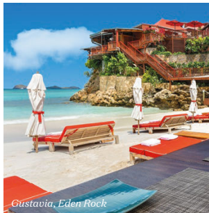
Gustavia, Eden Rock